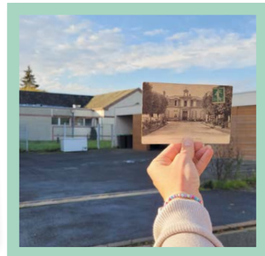
L'emplacement de l'ancienne maternité.