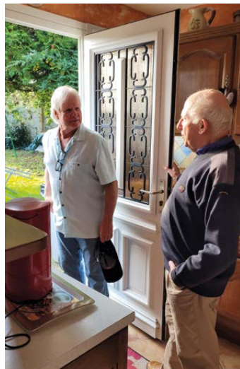
La découverte de la maison